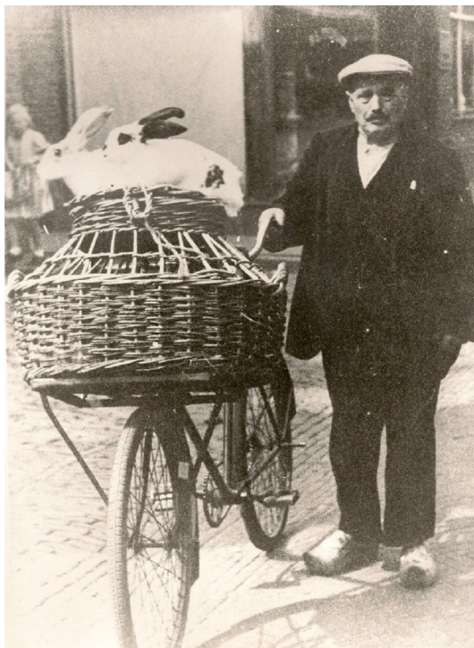
de olde Haye

Ik kan hem nog heel goed herinneren. Het was een bijzondere en gezellige buurman. Als kind ging ik bij 'de olde Haye' voor op zijn transportfiets naar de Volksfeesten in Lierderholthuis. De te nemen brug voor de spoorwegovergang maakte in die tijd een flink kabaal. Het betrof n.l. een houten brug en buurman Haye legde daar natuurlijk nog even een schepje boven op ! Net als de 'schrik van Harculo' ! Oh, en wat hebben we veel gekaart. Er is wat af gejojerd in die tijd en een tussendoortje